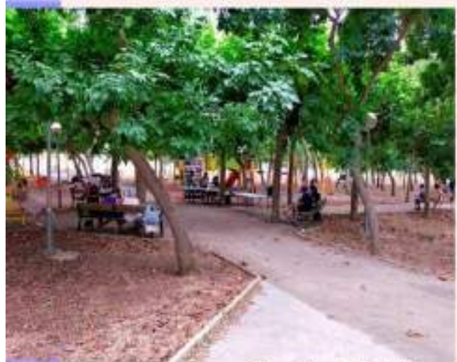
Parada de Rubiales