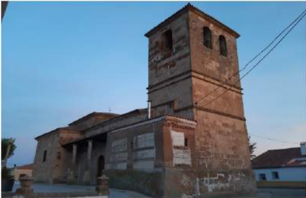
La iglesia de Parada de Rubiales restaurada. En primer plano el cuarto de la torre levantado en 1804 como apoyo a la torre que amenazaba ruina. También se aprecian los salientes de piedras en ambos cruceros, y la primera cornisa de la torre, muestras de una obra inacabada.